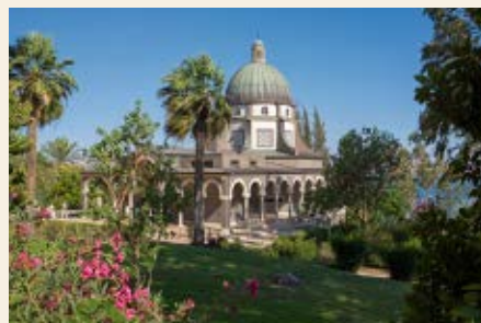
Der Berg der Seligpreisungen – Israel