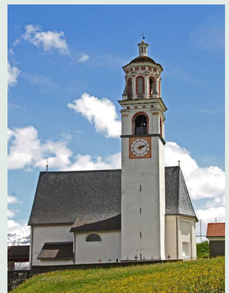
baselgia s. Niclo Parsonz